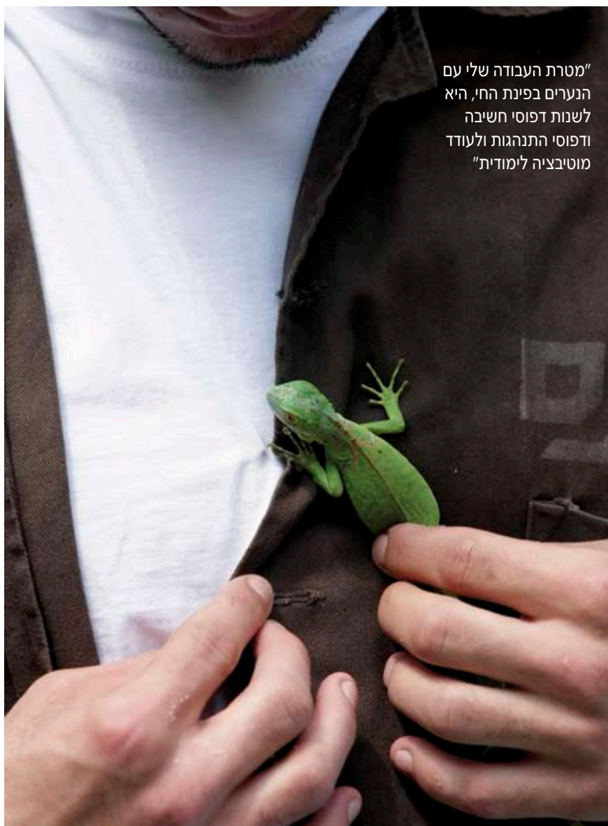
"מטרת העבודה שלי עם הנערים בפינת החי היא לשנות דפוסי חשיבה ודפוסי התנהגות ולעודד מוטיבציה לימודית"