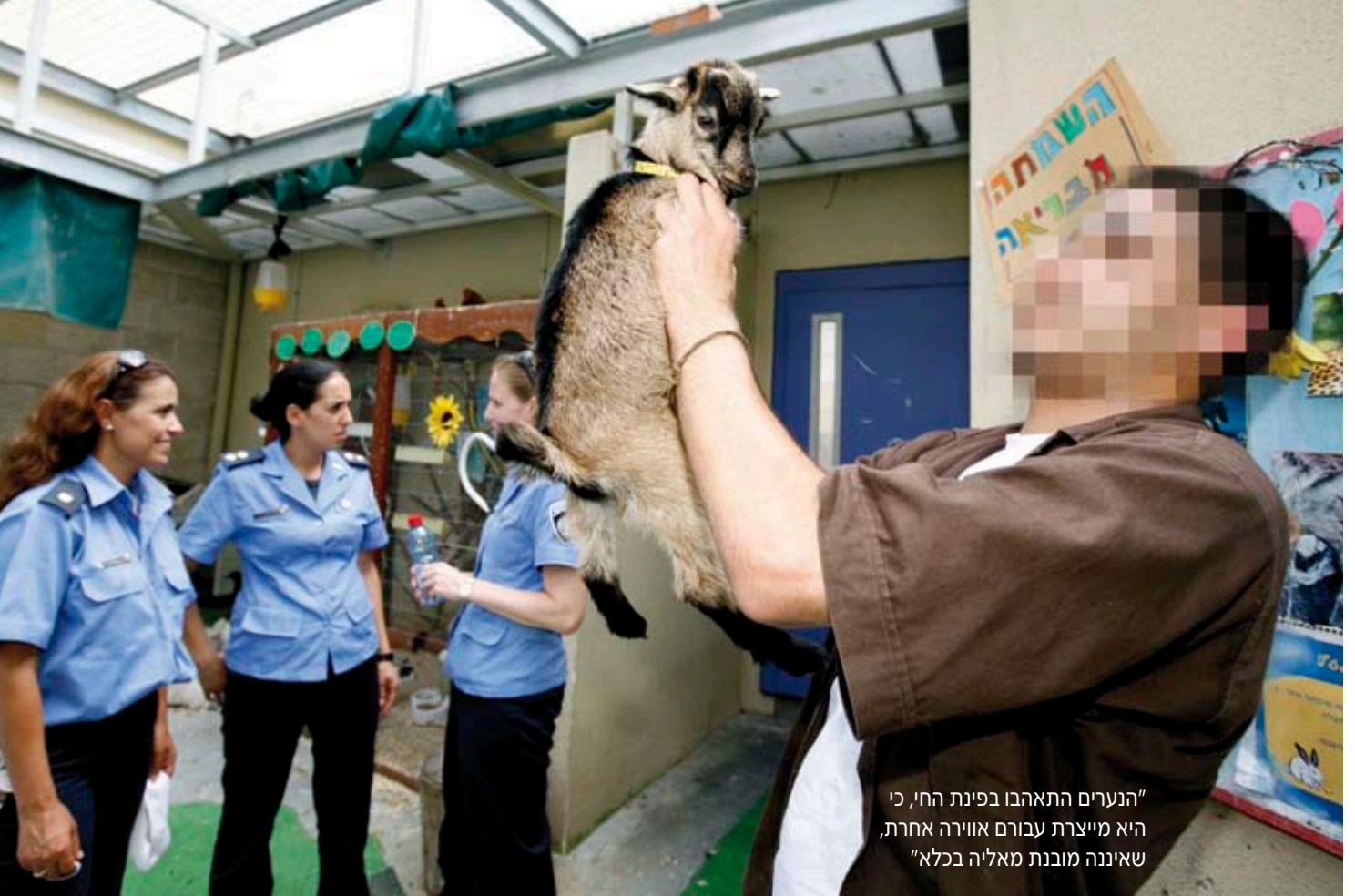
"הנערים התאהבו בפינת החי, כי היא מייצרת עבורם אווירה אחרת, שאיננה מובנת מאליה בכלא"

ראשון במעלה להקניית ערכים אנושיים ולהתפתחות אישיות בריאה ואוהבת, המסוגלת להסתגל לנורמות חברתיות. בדרך כלל המשפחה היא מעבדה לתהליכים החברתיים אתם יוצא הילד לעולם, ולכן יש לה השפעה משמעותית על עיצוב אישיותו. את התוצאות של גדילה במשפחה לא מתפקדת אפשר לראות על מי שעברו על החוק ושוהים בכלא. הטיפול התרופי באמצעות בעלי החיים מהווה תחנה בחזרה לבריאות נפשית ורגשית."