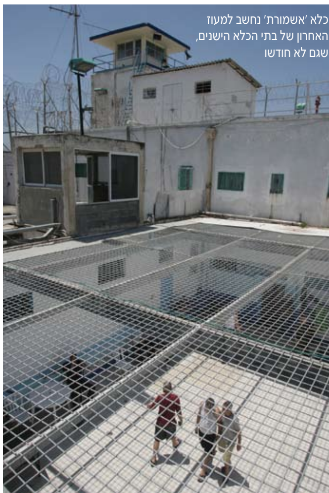
כלא 'אשמורת' נחשב למעוז האחרון של בתי הכלא הישנים, שגם לא חודשו