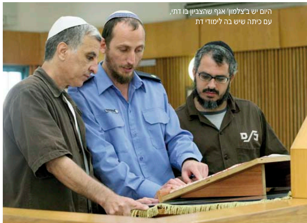
היום יש ב'צלמון' אגף שהצביון בו דתי, עם כיתה שיש בה לימודי דת

"התבקשנו להתנהל בצביון דתי יותר. העלינו את הבקשה למפקד המחוז, שנעתר. היום יש לנו אגף שהצביון בו דתי, עם כיתה שיש בה לימודי דת, תפילות וכל ההתנהלות בה צנועה יותר. אנחנו עושים הכל גם כדי לשלב את משפחות האסירים: כשיש הכשרה מקצועית המשפחה מגיעה לפתיחת הקורס, לאחד מהשיעורים במהלכו וכמובן לאירוע הסיום. גילינו ששיתוף כזה מחזק. אנחנו מתכננים גם לפתוח קנטינה שתשרת את משפחות האסירים בזמן הביקורים. המטרה היא שאסיר יוכל לקנות במבחה לילד שלו בזמן הביקור. אנחנו רוצים לבנות גם משחקיה. ראיתי דבר כזה בסקוטלנד, במסגרת משלחת של שירות בתי הסוהר, ואני רוצה לממשו כאן".