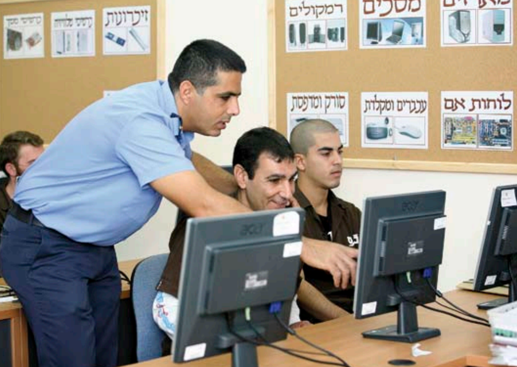
הפעילויות מתקיימות יום וערב וכוללות כיתות לימוד, מפעלים, קורסים להכשרה מקצועית, חוגי תיאטרון, מוסיקה, מחשבים ואפילו חדר כושר