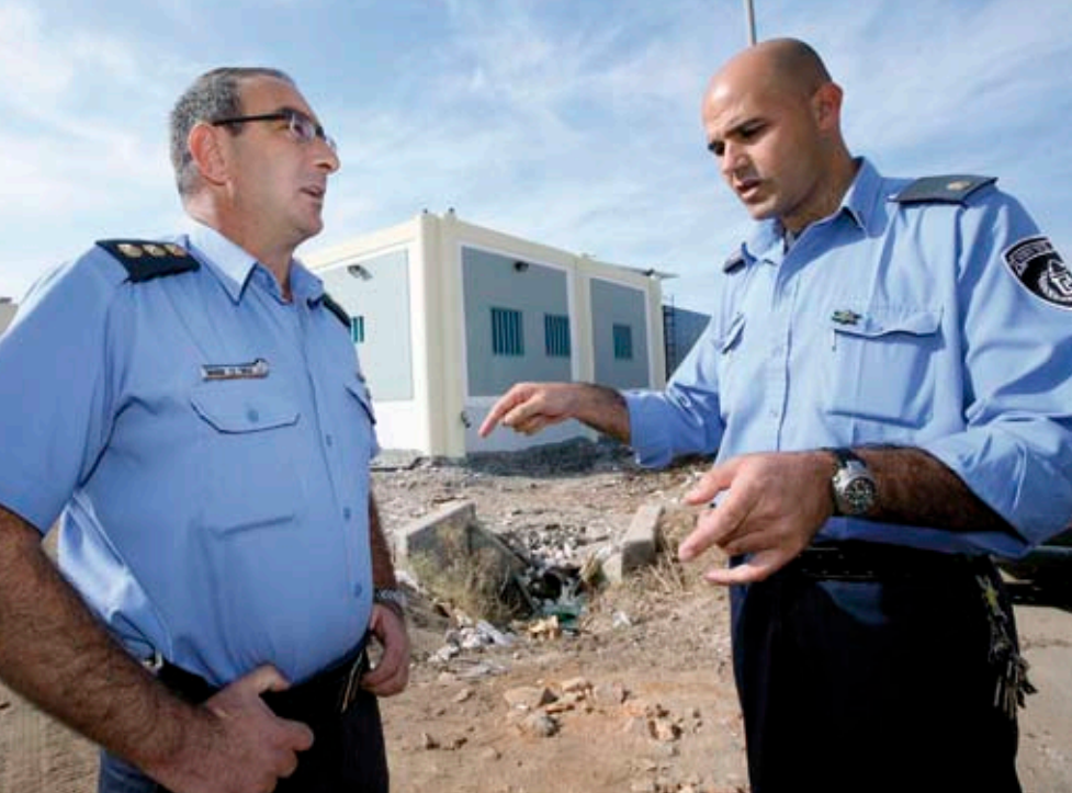
לאחרונה נחנך בכלא אגף מיוחד לעצורים, אגף זה ישרת את יחידות המחוז הצפוני של משטרת ישראל