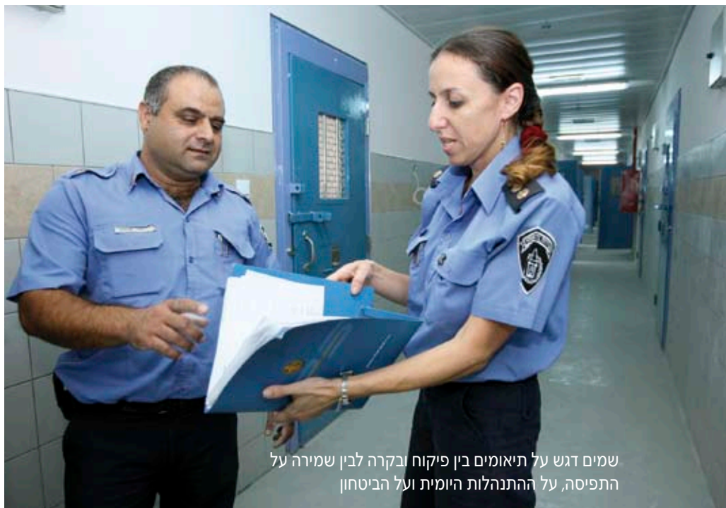
שמים דגש על תיאומים בין פיקוח ובקרה לבין שמירה על התפיסה, על ההתנהלות היומית ועל הביטחון