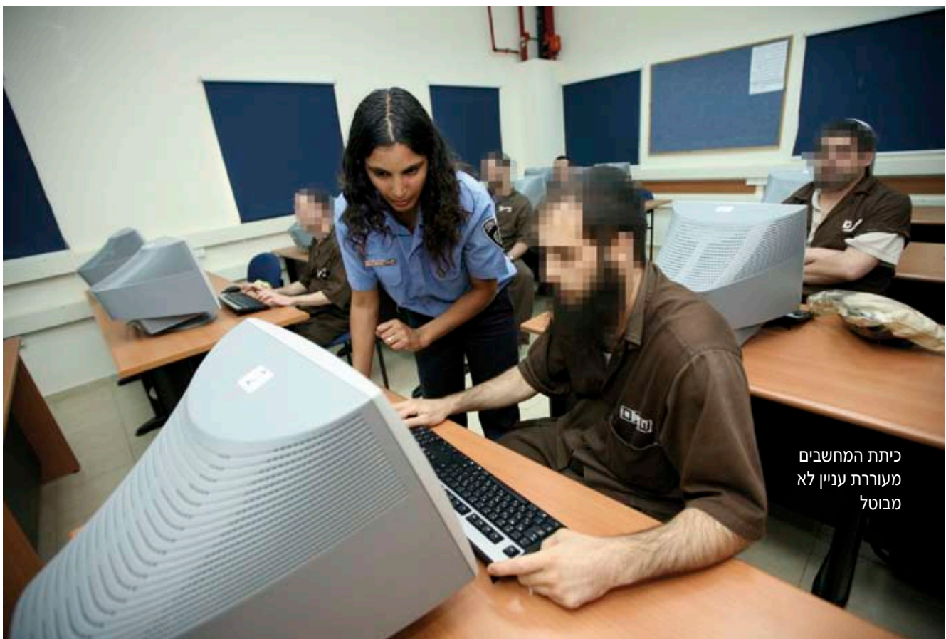
כיתת המחשבים מעוררת עניין לא מבוטל

כלא 'דקל' בבאר שבע משדר סדר, ניקיון, משמעת והצבת גבולות ברורים ל-1005 האסירים