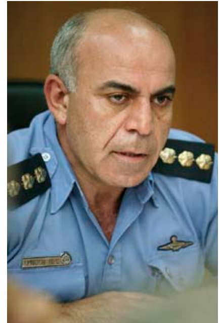
גנ"מ סימון אליקשוילי